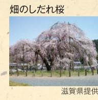
畑のしだれ桜